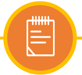
经典汽车行业活动