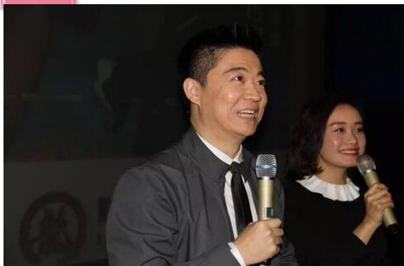
主持人与听众问好