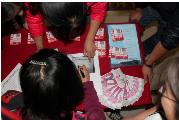
《早安音乐秀》听众签到