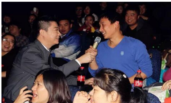
互动游戏:讲讲备胎/前任经历