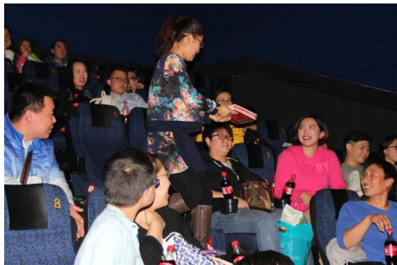
工作人员为讲述备胎经历的听众发《前任2》笔记本