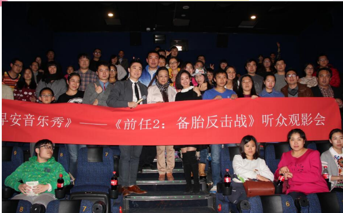
主持人及北京音乐广播台长与全场观众合影留念