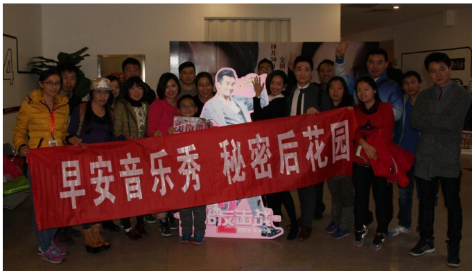
入场前主持人和听众与郑恺展板合影