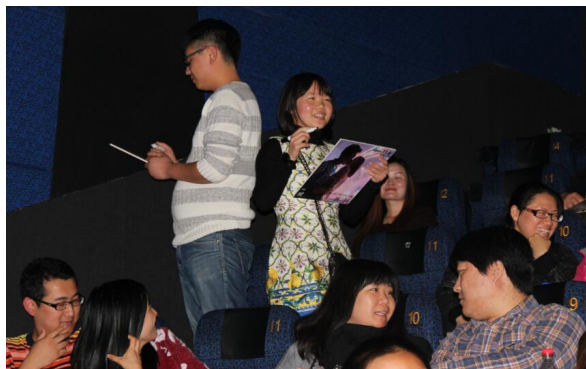
互动游戏：情侣默契考验