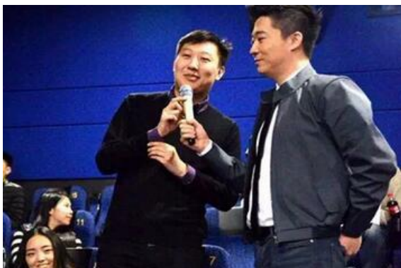
互动游戏:讲讲备胎/前任经历