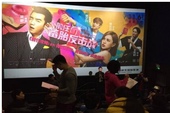
互动游戏：情侣默契考验