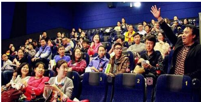
听众积极参加互动游戏